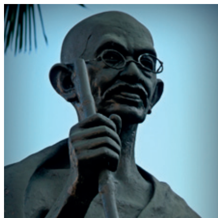
Ghandi. Marcha do Sal (1930) (India).