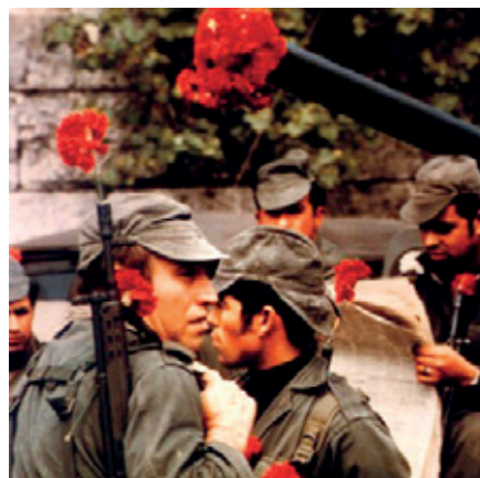
Revolución dos cravos 1974 (Portugal)