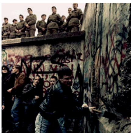
“O outono das nacións” Caída do muro de Berlín (1989)