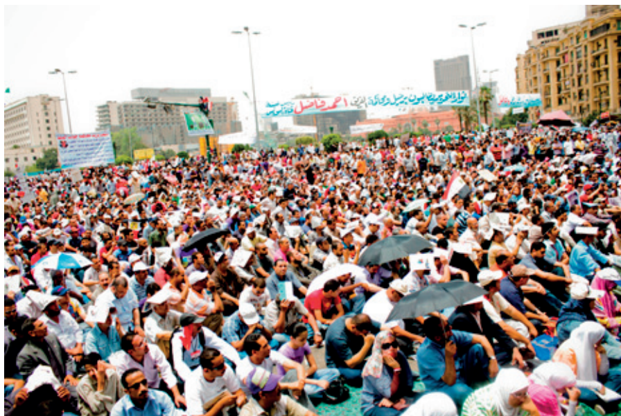
Protesta en la plaza Tahrir.

“Zoria edo halabeharra ezik, zernahi izan zen milioika egiptiar kaleratu zuena”, idatzi du Tahar Ben Jellounek “Arabiar udaberria, duintasuna itzartzea” liburuan. Dena zaku berean sartzerik ez badago ere, idazleak hor hauteman duena beste hainbat matxinadari ere aplika dakioke. Kasu denetan ere, albiste harrigarri gisa agertu zena urte edo mendetan ernarazten ari zen: honek balio du bai gertakizuna probokatu zuten kausei aplikatzeko, baita bera posible bilakatu zuten gorabeherei ere. Arabiar herrialdeetatik iristen zaigun okerreko ikuspegia, batetik; prozesuak gertakari-segida bihurtzen duen komunikazio mediatikoa, bestetik; informazio-ekutatzeko edo isiltasun esanguratsu eta, maiz, interesatuak, hirugarrenetik... denek bat eginik, badirudi orain existitzen zenik ere ez genekien sumendiak eztanda egin duela bat-batean.