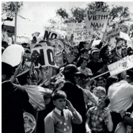
Manifestacions contra la guerra del Vietnam (1964) (EUA)