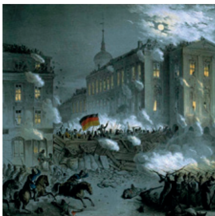
“La primavera dels pobles” Revolucions de 1848