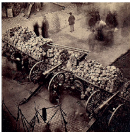
Vaga de la Canadenca (Barcelona) (1919)