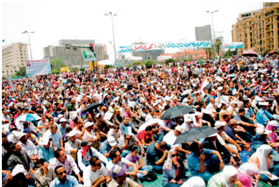
Protesta a la plaça Tahir.

“Va ser tot menys l'atzar el que va fer sortir milions d'egipcis al carrer”, escriu Tahar Ben Jelloun en el seu llibre La primavera àrabe. El despertar de la dignidad . Tot i que no es pot ficar tot dins el mateix sac, segurament l'apreciació de l'escriptor francomarroquí és extensible a altres revoltes. En tots els casos, el que va aparèixer com a notícia insòlita feia anys, dècades, potser segles que es gestava; i això és vàlid tant amb relació a les causes que ho van provocar com a les circumstàncies que ho van fer possible . La visió distorsionada que ens arriba dels països àrabs, juntament amb una comunicació mediàtica que sol reduir els processos a una successió de fets, sense excloure uns significatius –interessats?– silencis informatius, ajuda que ens hagi sorprès l'erupció d'un volcà sense que ni tan sols ens haguéssim adonat que existia.