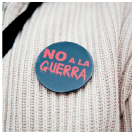
“No a la guerra” (2003)