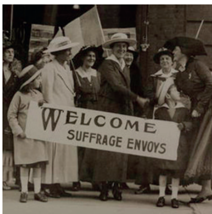
Manifestacions sufragistes. Declaració de Seneca Falls (1848)