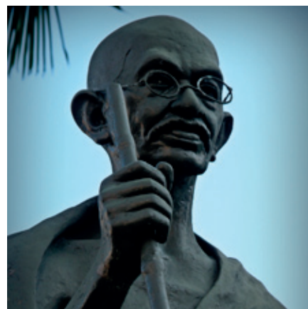
Ghandi. Marxa de la Sal (1930) (Índia)