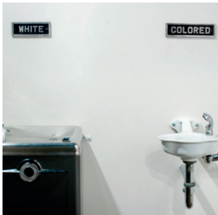
Boicot contra els autobusos, Martin Luther King (1955) (EUA)