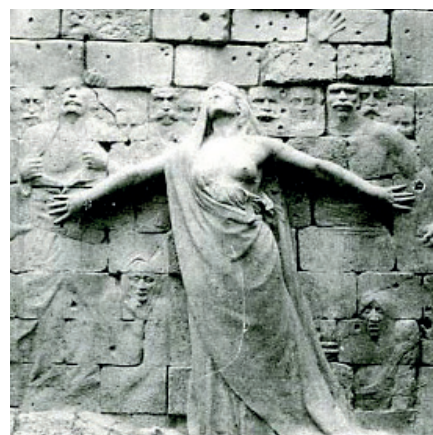
Comuna de París (1871)