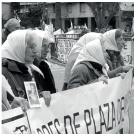
Mares de la Plaza de Mayo (1977) (Argentina)