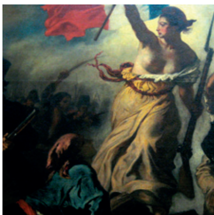
Revolució Francesa (1789)