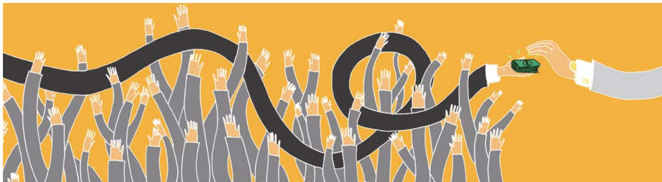
© Yang del Castillo, Escola Massana

Poden ser moi diverxentes. Por exemplo, España é un dos países de menor presión fiscal de toda a Eurozona, mentres que o esforzo fiscal se sitúa entre os máis altos, incluso por encima de algúns países escandinavos, sempre citados como exemplo de impostos altos.