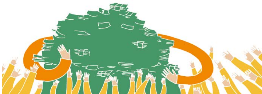
© Yang del Castillo, Escola Massana

En algun ministeri, com el de Defensa, fins i tot s'assegura la tendència amb vista al futur. L'exministra Cospedal va anunciar a primers d'any que els plans són augmentar fins a 18.000 milions els pressupostos anuals de Defensa en els pròxims cinc anys –l'any 2018 s'han superat per primera vegada els 8.000– i un pla d'inversions de 10.800 milions per a adquisicions dels exèrcits en els pròxims 15 anys. Jordi Calvo, del