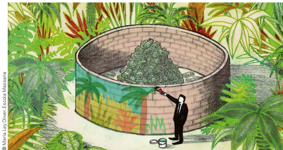
© Maria Ley Oliver. Escola Massana

Quants impostos paguen les empreses de l'Ibex 35 i on? En termes generals, a Espanya la pressió fiscal a les empreses és la meitat d'intensa que la que suporten els ciutadans. L'any 2016, l'Estat va recaptar tres vegades més per l'IRPF, que paguem les persones, que per l'Impost de Societats, a càrrec de les empreses. Però no totes caben al mateix sac. Encara que sembli paradoxal, el tipus impositiu i la mida de les companyies són inversament proporcionals.