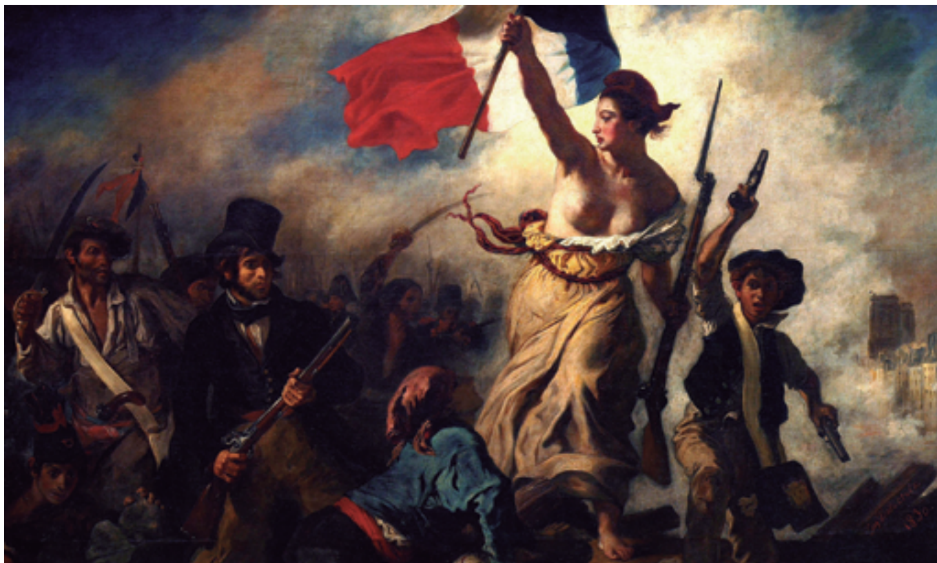
Pintura: Eugène Delacroix

Es considera un dret allò que es concedeix o es reconeix a un subjecte, segons circumstàncies molt diferents: el naixement, l'herència, el veïnatge, la conquesta, la feina, etc. En el cas dels drets humans, la circumstància és precisament aquesta: ser una persona. Són, doncs, inherents a tots els éssers humans pel sol fet de ser-ho, independentment de qualsevol tret diferencial: nacionalitat, lloc de residència, sexe, origen nacional o ètnic, color, religió, llengua o qualsevol altra condició. Atès que emanen de la dignitat de la persona, són universals (ningú no n'està exclòs), inalienables (a ningú no se li poden arrabassar), indivisibles , interdependents , interrelacionats (no són parcel·lables ni poden ser aplicats aïlladament: cap dret no és més important que un altre) i no condicionats (no es pot exigir cap mena de contrapartida). El deure corresponent a aquests drets és el respecte i la garantia als drets de les altres persones.