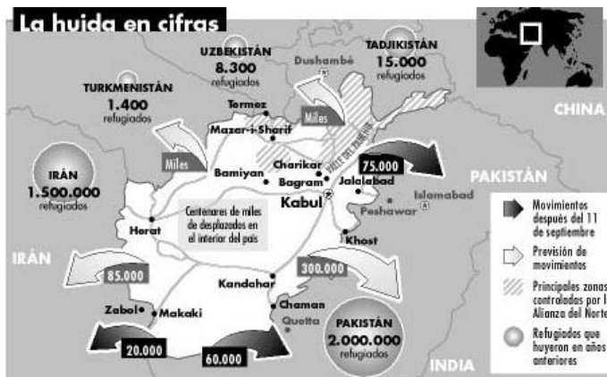
LA VANGUARDIA 8/11/01

La Creu Roja assegura que 500.000 afganesos poden morir de fam aquest hivern.