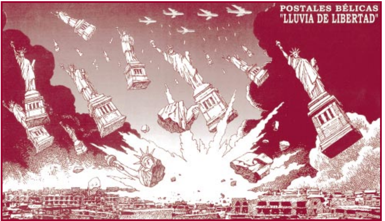
Ventura & Coromina publicado en La Vanguardia 27/03/03